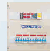
bei ZGP und ZGPE- (27-60 kVA) mit automatischer Umschaltung