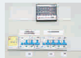
bei ZG- (10-31,5 kVA) mit Betriebsartenwahlschalter