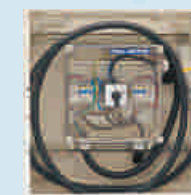
Optional: Notstrom-Einspeisestation CE konform entsprechend Niederspannungsrichtlinie 2006/95/EWG